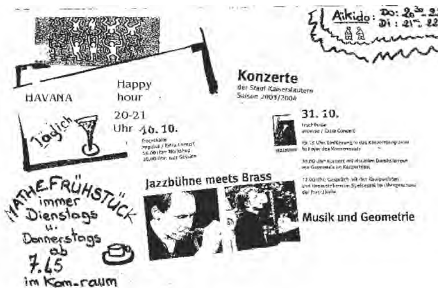
Abb. 5b. Ausschnitt aus dem Poster „Was ist im Oktober los?“ (s. 4a.)