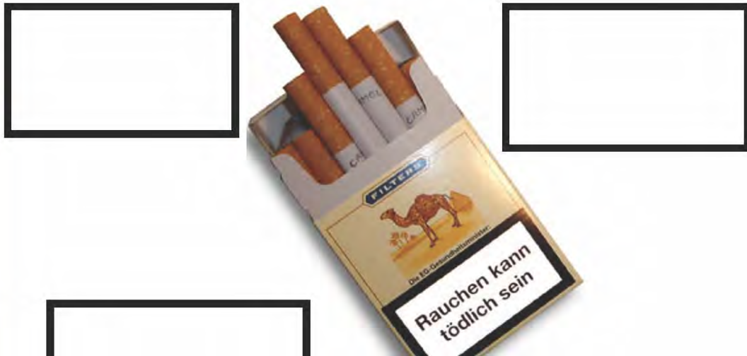
Abb. 8: Montage mit Spaßeffect (es werden auch Warnungen zu Schokolade, Autos, Alkohol und Bibliotheken verfasst).

Welche Warnhinweise gibt es auf Zigarettenschachteln? Was könnte noch darauf stehen? Erfinden Sie neue Warnungen: